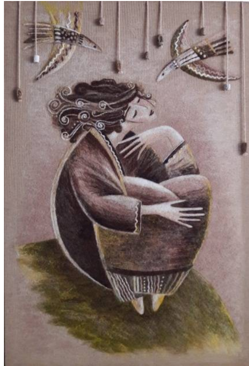
Рис. 2 – Декоративне панно «Замріяна» у техніці «живопис вовною»

Ще однією з сучасних технік «фелтингу» є різновид «сухого фелтингу» – повстяна «аплікація», або «вишивка» чи «живопис вовною», як її називають у різноманітних джерелах. Таку техніку розробила та досконало опанувала художниця Дані Айвс (Dani Ives). Мисткиня створює приголомшливі й неймовірно реалістичні картини, зображуючи на них тварин та рослини. Створення гіперреалістичних зображень тварин пензлем або олівцем – мистецтво, яке можуть опанувати тільки найпрацелюбніші художники, але зробити це голкою і вовною здається абсолютно неможливим (Juli Leskonog, 2017). Особистий досвід із опанування техніки та виготовлення у ній декоративного панно «Замріяна» (рис. 2) дає можливість дещо уточнити технологію.