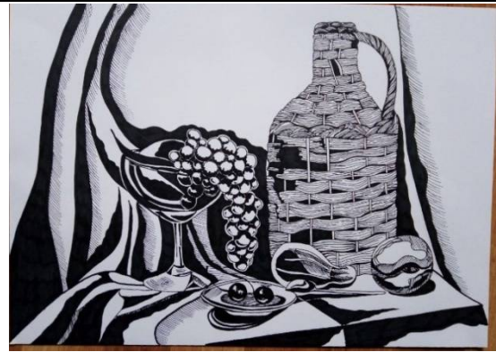
Рис. 5. Натюрморт з натури. Вандоляк Т. Рис. 6. Стилiзацiя натюрморту. Вандоляк Т.

Не менш значну роль в опануванні рисунком відіграють короткочасні зарисовки – це стисла, скупа за засобами розповідь про те, що зображується. На відміну від довготривалих завдань, тут немає ґрунтовного пропрацювання форми та деталей, проте міститься явна психоемоційна складова, що також важливо для накопичення певного досвіду, пробудження творчої активності (Піддубна О. М., 2012, с. 413).