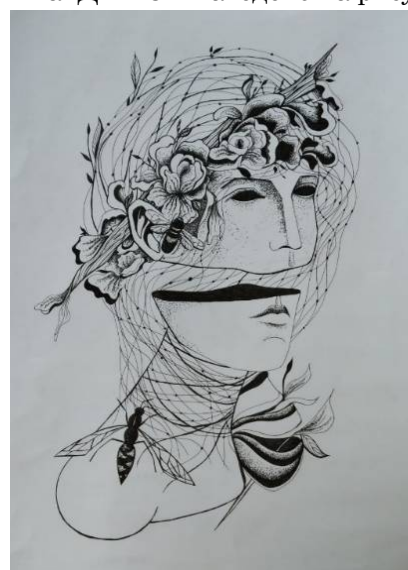
Рис. 4. Стилїзована голова. Макогін А.