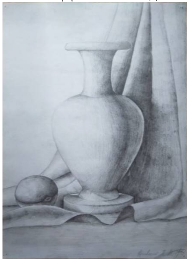
Рис. 1. Антична ваза. Краєвський П.

Особливою популярністю так званий геометральний метод користується на першому-другому курсі під час рисування класичних античних фігур, розеток та частин тіла, хоча і старшокурсники також часто згадують про його ефективність. Приклад виконання завдання із застосуванням даного методу студентами групи ДМ-19-1 та ДМ-18-1 наведено на рисунках 1, 2.