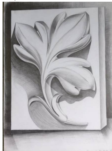
Рис. 2. Гіпсова розетка. Малютин М.

По-третє, об'ємна форма предмета передається на малюнку не тільки правильною перспективною і конструктивною побудовою, а й світлотінню. Кожний об'ємний предмет обмежується кривими або