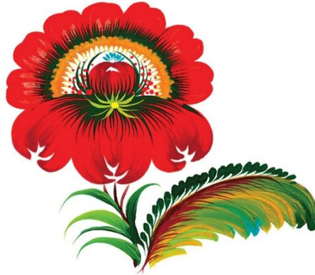
Мал. 3. «Кучерявка»

На пензель набирають спочатку жовту фарбу, потім умочають його кінчик у червону, виконуючи «перехідний» мазок. Коли готова червоно-жовта «цибулька», на палітрі викладають третю пару фарб: зелену-жовту і малюють ще ряд «цибульок» [3, с. 43].