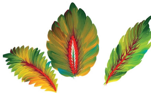
Мал. 4. «Листя»

У такий же спосіб створюють і бічні частини листка. Прожилки листка можна намалювати темнішою фарбою. Листки можна малювати і «перехідним» мазком. На пензлик набирають фарбу, витримують пензлик «п'яткою» донизу декілька секунд, щоб фарба стекла в «п'ятку», відтак кінцем пензлика набирають темнішу фарбу. Протягують по аркушу кінчиком пензлика, завершують «п'яткою» й отримують поступовий гармонійний перехід темного кольору у світлий. Можна зробити і навпаки, тобто щоб світлий колір переходив плавно у темний. Малювати листки клену, калини, винограду потрібно намалювавши спочатку середину листка видовженим мазком, інші мазки розміщують під гострим кутом до середини – це зубчики листка. Ці листки складаються з трьох подібних частин зубчастої верхівки і двох бічних. Починають малювати з центральної частини, із середнього зубчика, видовжений мазок якого буде основною лінією всього листка. Так само малюють сусідні бічні зубчики. Потім малюють середню, бічну частину листка, знову починаючи із середнього зубчика. Вісь середньої частини листка розміщена під гострим кутом до основної осі листка. Ця нижня, третя, частина розміщується під прямим або тупим кутом до осі листка. Головне зображення можна залишити в одному кольорі або виділити прожилки темнішим кольором. Після набуття певного досвіду у виконанні цього завдання доречно робити малюнки відразу фарбою, не застосовуючи олівець.