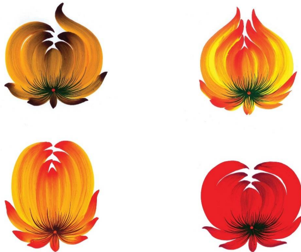
Мал. 2. «Цибульки»

«КУЧЕРЯВКА» (мал. 3) також вигадана квітка. Якщо уважно придивитися, то можна помітити: пелюстки квітки мають форму «цибульки». Зверху вони невеликого розміру, а знизу більші.